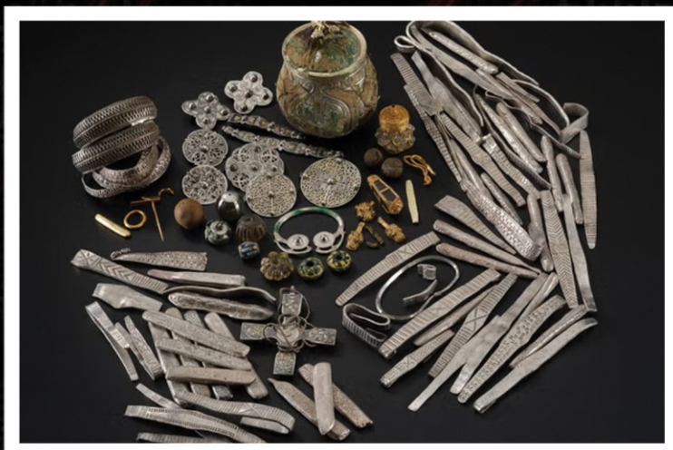
പുരാവസ്തു ശേഖര സ്മാൾ