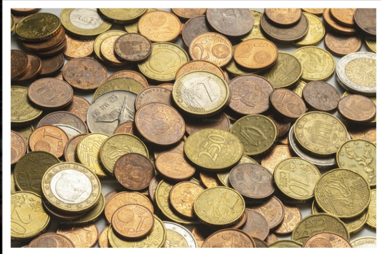
അമൂല്യ നാണയശേഖര സ്മാൾ