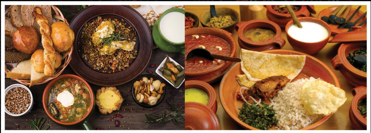
വിദേശരാജ്യങ്ങളിലെ ഭക്ഷണശാല, കേരളീയ ഭക്ഷണശാല