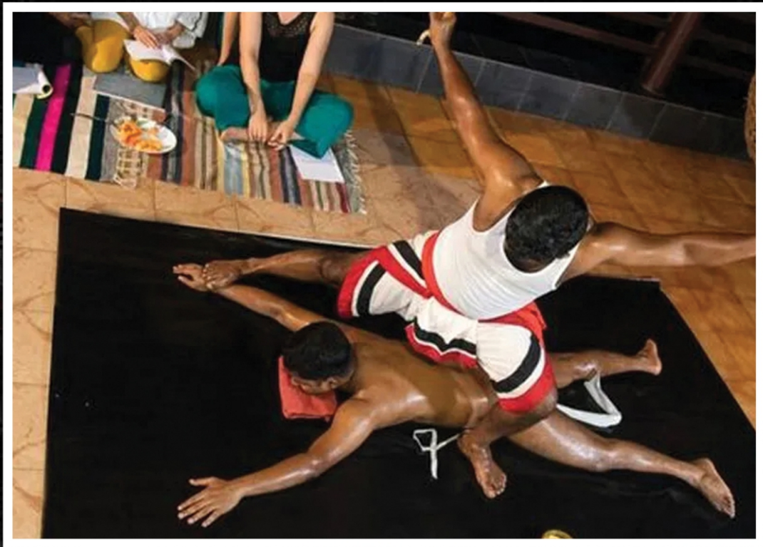
പാരമ്പര്യ കളരി മത്സര ചികിത്സ ഡെമോൺസ്ട്രേഷൻ