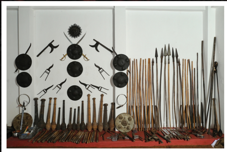
ആയുധ ശേഖര സ്മാൾ